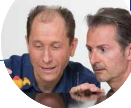
Öpäsö Samstag, 20:00h, Haberhaus