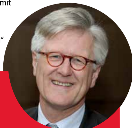
Heinrich Bedford-Strohm Sonntag, 13:00h, Fronwagplatz