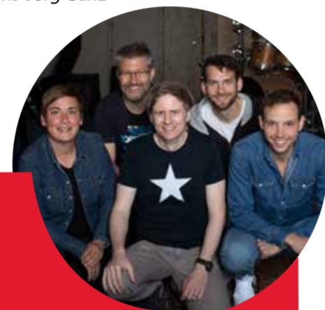
Rockets Samstag, 17:00h, Fronwagplatz