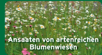
Ansaaten von artenreichen Blumenwiesen