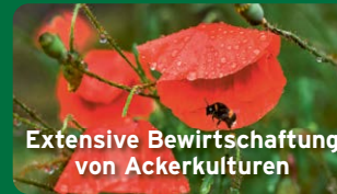
Extensive Bewirtschaftung von Ackerkulturen