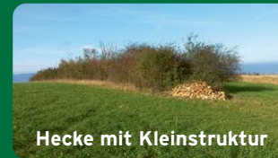
Hecke mit Kleinstruktur