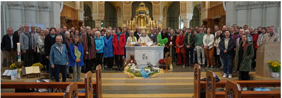
Teilnehmende der Feier zu 10 Jahre Grüner Güggel am 4. Oktober 2025 in Romanshorn Célébration des dix ans du Coq vert le 4 octobre 2025 à Romanshorn (TG)

Émissions de CO 2 e : 108 tonnes Énergie électrique : 78 360 kWh Énergie thermique : 342 000 kWh